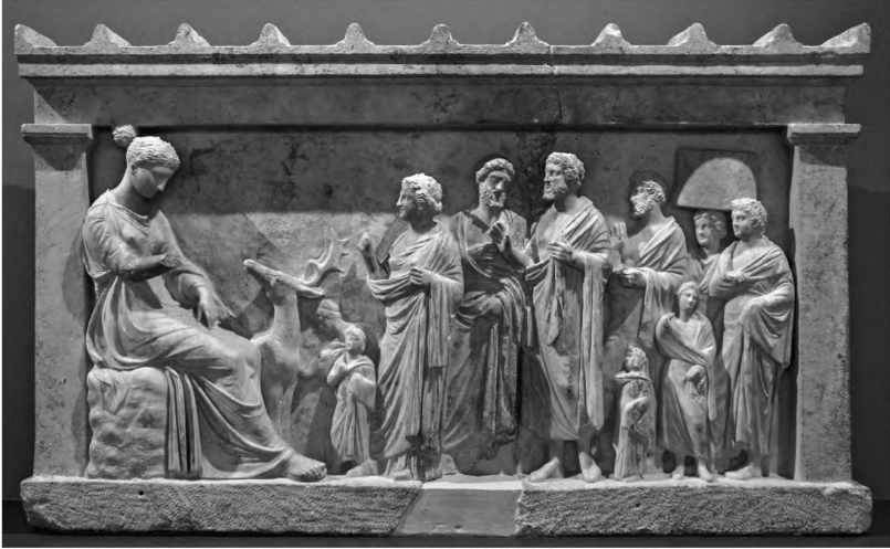
Abb. 1: Votivrelief mit Betenden vor Artemis. Brauron, Arch. Mus. Inv. 1153.

ten bei der Interpretation geführt. Aber in der Masse scheint sich ein antiker Konsens herausgebildet zu haben, der diese spezielle Armhaltung in erster Linie als Beten im Sinne einer Ansprache an die Gottheit auffasst, und in der Fachsprache gewöhnlich als Oransgestus oder Orantengestus bzw. -motiv bezeichnet wird. 6