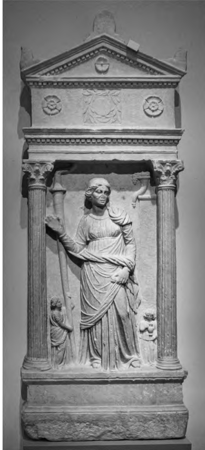
Abb. 4: Grabrelief einer Demeterpriesterin aus Smyrna. Berlin, Staatl. Mus., Antikenslg. Sk 767.

und dafür geehrt wurden, 24 könnte man erwarten, dass die Ikonographie der Orans für ihre Ehrenstatuen als besonders angemessen erschien. Im