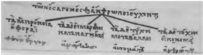
Abb. 2: BnF, Paris. gr. 1962, f. 36r, unterer Rand.

Noch ausgefeilter ist die Darstellung der vier Kräfte in § 4, die auf das menschliche Leben einwirken. Sie sind in Form eines Baumdiagramms angeordnet, das den Bereich „all jener Dinge, für die Menschen beten, dass sie eintreffen mögen“ unterteilt nach „was die Vorsehung beaufsichtigt“, „was das Schicksal erzwingt“, „was der Zufall verändert“ und „wofür die eigene Fähigkeit verantwortlich ist“. Ein weiteres Label erklärt jeweils, dass diese Ereignisse „das Werk Gottes“, „das Werk der Notwendigkeit“, „das Werk des Zufalls“ oder „das Werk des Menschen“ sind.