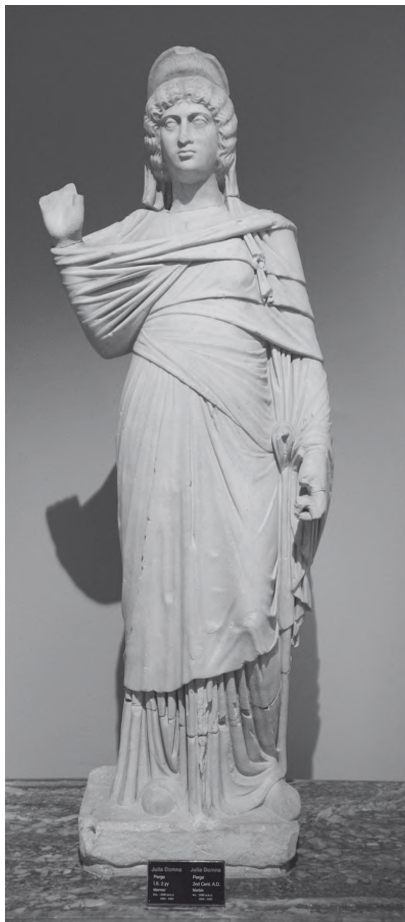
Abb. 5: Julia Domna als Orans vom Nymphäum in Perge. Antalya, Museum Inv. A3262.

Gebetsgestus seit der augusteischen Zeit von Kaiserinnen wie Privatpersonen verwendet wurde, um ihre pietas und gegebenenfalls ein Priesteramt zum Ausdruck zu bringen, und dass diese Tugend auch, aber nicht nur im Falle von Priesterinnen, als besonders hervorhebenswert erachtet wurde. Wie oben bereits angedeutet, spricht einiges dafür, dass die spezifische pietas der Frauen pietas erga parentes und erga familiares war. Auch die Pietas-Münzen beziehen sich oftmals ausdrücklich auf diese dynastische und familiäre pietas , wie u.a. die seit den 80er Jahren und bis ins 4. Jh.