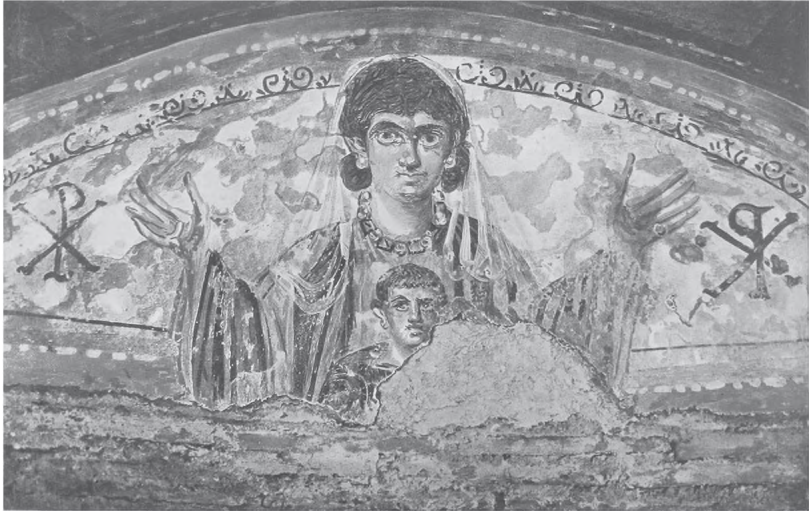
Abb. 8: Orans mit Kind aus dem sogenannten Cubiculum della Madonna, Rom, Coemeterium Maius.

Wo in entsprechender Position, etwa in den Seitenpanelen von Strigilisarkophagen, Männer erscheinen, handelt es sich in erster Linie um den ‚Guten Hirten‘, dann auch um Männer in Himation (griechischem Mantel) und mit Buchrolle. Diese tragen jedoch in aller Regel keine Porträtzüge und sind oft gedoppelt, so dass es sich entweder um generische Gelehrte oder aber um Apostel handeln muss. 98 Im Zentrum der Kompositionen kommen, von wenigen meist nicht eindeutig christlichen Ausnahmen abgesehen, 99 sogar ausschließlich der ‚Gute Hirte‘ und später Christus vor. Männliche Porträts finden sich fast ausschließlich als Büsten in Clipei (Rundschilden) oder vor einem Parapetasma (Vorhang) auf den Deckeln in den seit dem 2. Jh. bekannten Ikonographien, sind aber auch dort leicht in der Minderheit. 100 Dieses Ungleichgewicht 101 lässt sich weder durch das verständliche Verschwinden des Opfernden erklären, noch durch den