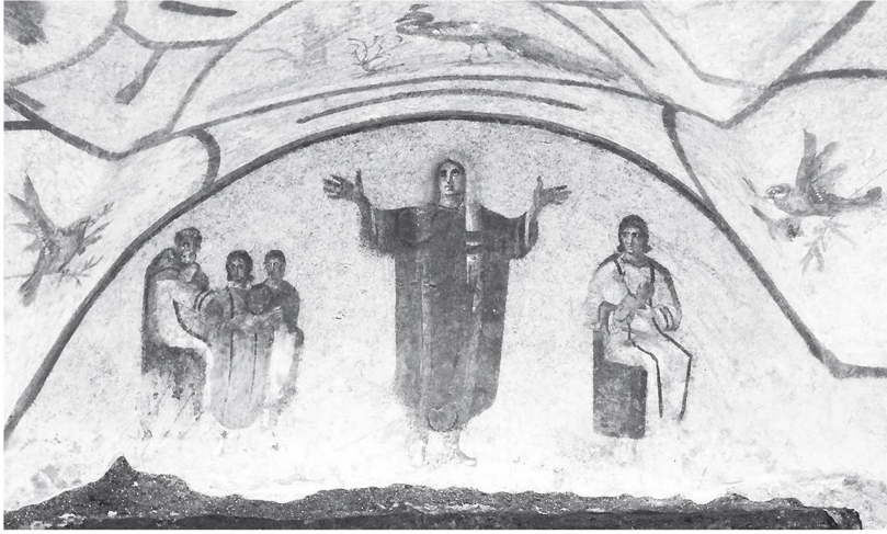
Abb. 7: Sog. Velata-Cubiculum, Rom, Priscilla Katakombe.

deutige Hinweise hinzutreten, auch offen gelassen, ob es sich bei diesen Darstellungen von Verstorbenen auch um Darstellungen als Verstorbene, d.h. in einem jenseitigen Zustand handelt. Tugendlob als solches hat den Vorzug, dass es sich sowohl auf die positiven Eigenschaften einer Person in der Vergangenheit als auch auf ihre Haltung in Gegenwart und Zukunft beziehen kann. Eine solche Zurschaustellung von Tugenden fügt sich nicht nur bestens in die gesellschaftliche Tradition ein, sondern auch in die verschiedentlich nachweisbare Vorstellung, dass die Christen ihr jenseitiges Schicksal ihrer diesseitigen Tugendhaftigkeit zu verdanken haben. 93