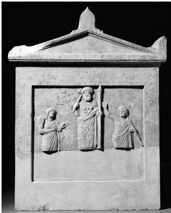
Abb. 2: Ada und Idriacus vor Zeus Labraundos auf einem Relief aus Tegea. London, BM inv. 1914.7-14.1.