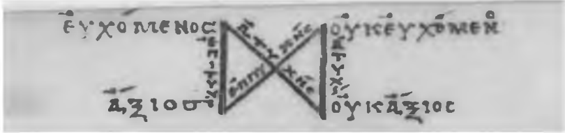
Abb. 1: BnF, Paris. gr. 1962, f. 36r, oberer Rand.

de. 92 Or. 5 ist eine der wenigen Vorlesungen in dieser Handschrift, die am oberen und unteren Rand mit Anmerkungen versehen ist, die Kernpunkte der Argumentation schematisierend zusammenfassen. 93 Die Diskussion über das Verhältnis von Würdigkeit und Gebetserhörung in § 3 wird hier in vertikale und diagonale Linien angeordnet, wobei die Voraussetzungen „betend“ / „nicht betend“ und „würdig“ / „nicht würdig“ um die Scheitelpunkte herum angeordnet sind, und das jeweilige Ergebnis „erfolgreich“ / „nicht erfolgreich“ an den Verbindungslinien steht. 94