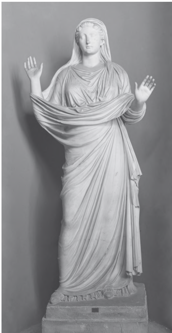
Abb. 3: Statue der Livia als Orans aus Otricoli. Vatikanische Museen, Gall. dei Busti 352.

ten, dass es sich vielleicht nicht um Bilder von Gottheiten handelte, sondern um menschliche Beterinnen. In jedem Fall ist die Boidas-Statue männlich und kommt somit nicht in Frage. Sie wird gelegentlich in dem „Betenden Knaben“ in Berlin erkannt (zur Skulptur